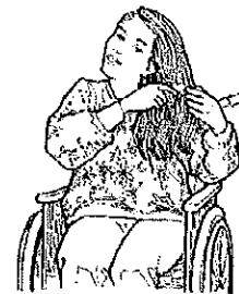
4. Ma sœur