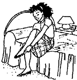
1. Moi, je

5 Décris les activités des personnes suivantes, d'après les images. Utilise les pronoms donnés.