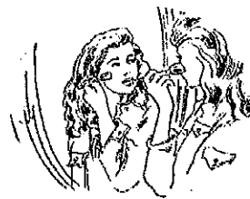
3. Ma mère