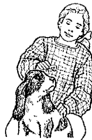
2. Toi, tu